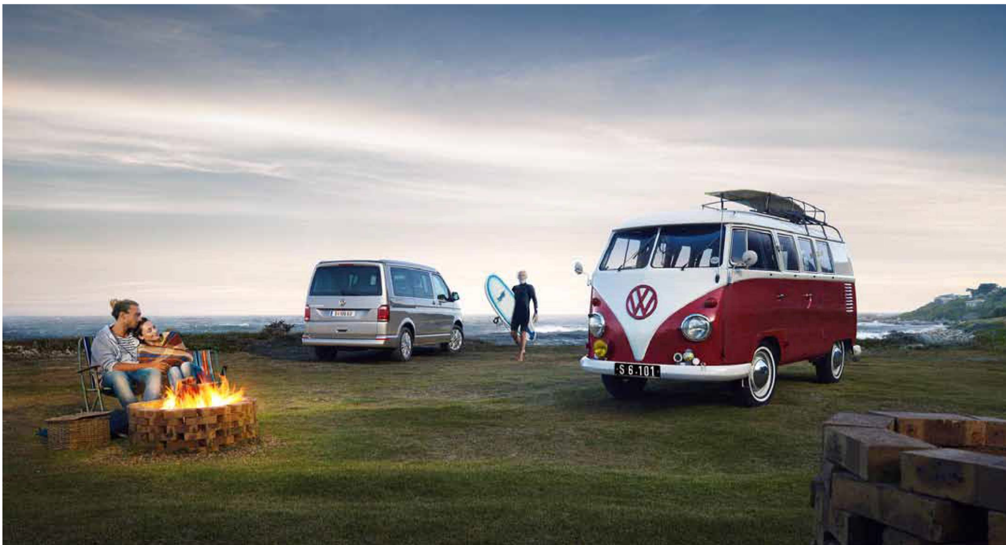
Vom ersten Bulli mit Camping-Aufbau bis zum aktuellen T6 California sind inzwischen 30 Jahre ins Land gegangen.