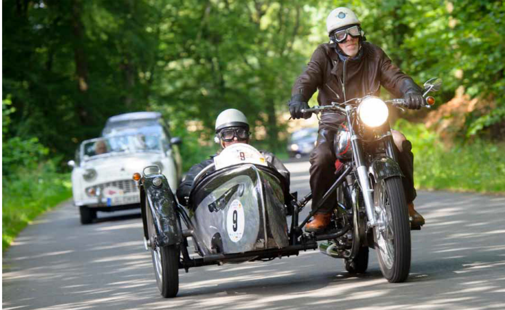
So eine tolle Horex mit Beiwagen sieht man auch nicht alle Tage.

Fahrzeuge aus den Wirtschaftswunderjahren zwischen 1950 und 1970 dominieren das Feld. Das älteste Auto zählt 95 Jahre.