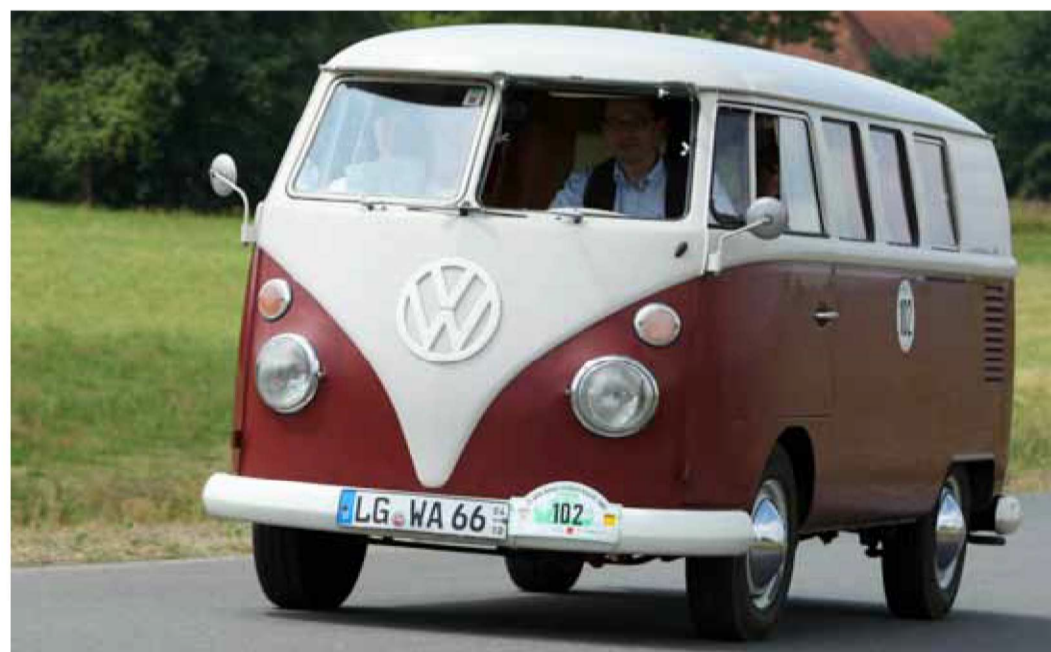
Der VW Bus T1 gehört heute zu den gefragten Sammlerstücke.

Nur einen Schönheitsfehler hat die Geschichte: Zwar hat VW den Transporter auch in den USA verkauft – aber ausgerechnet der California hat es trotz seines Namens auf offiziellem Weg nie nach Amerika geschafft. Doch was nicht ist, kann ja noch werden. In zwei, drei Jahren schließlich geht – nicht zuletzt auf Druck aus Amerika – der elektrische I.D. Buzz im Stil der alten Transporter in Serie und böte allemal genügend Platz für einen Wohnmobilausbau. dpa/md