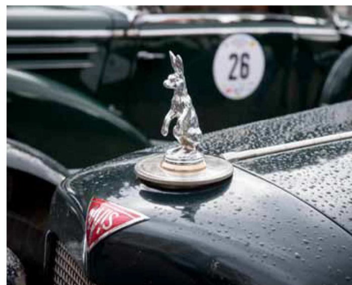
Selbst Kühlerfiguren waren früher echte Kunstwerke.