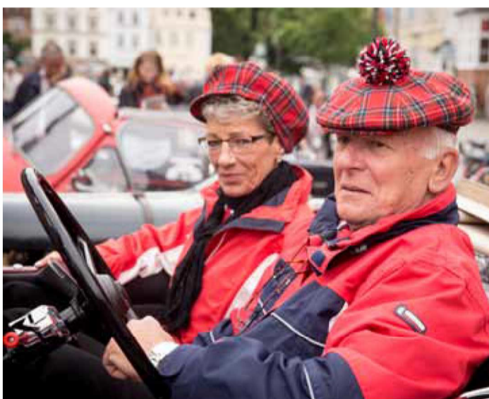
Stiliche Kleidung gehört auch dazu.