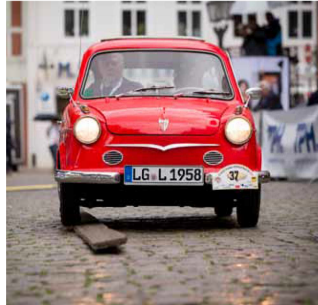
Einermaßen genau trifft der kleine Prinz das Spurbrett kurz vor der Zielankunft auf dem Lüneburger Marktplatz.

Auch einen Dank an die Behörden und die Polizei für ihre große Kooperationsbereitschaft will Moormann loswerden. Besonders auch an die Sponsoren, die mit ihren Zuwendungen dazu beitragen, dass das Startgeld überschaubar bleibt. cst