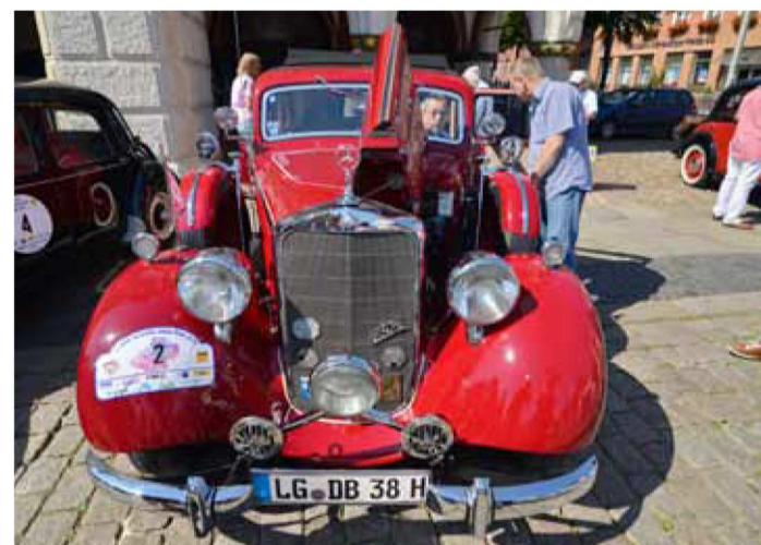
Mit einer auf alt getrimmten Batterie wirkt der Motorraum des Oldtimers noch authentischer.

Wer die Optik unter der Motorhaube pragmatisch sehe, könne beruhigt zu einer normalen Autobatterie greifen, erklärt die Prüforganisation. dpa/md