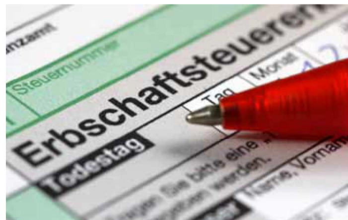
Auch Oldtimer gehören zu den Hinterlassenschaften, für die sich das Finanzamt interessiert.

Grundsätzlich gilt: Wer im Besitz etwa von wertvollen Kunstgegenständen ist, sollte sich frühzeitig Gedanken machen, was nach seinem Tod damit passieren soll. Sinnvoll kann sein, rechtzeitig qualifizierte Gutachten anfertigen zu lassen und eine Dokumentation zu der jeweiligen Sammlung mit genauen Daten und eventuellen Vorbesitzern zu den übrigen Vermögensunterlagen zu legen. dpa/md