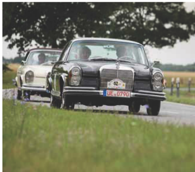
Unterwegs auf freier Wildbahn: Die Pracht-Sterne lassen es lieber gemütlich angehen.

Hansa Veteran Rallye. Das Feld der historischen Fahrzeuge war damals noch höchst überschaubar, die Teilnehmer, eine kleine eingeschworene Gruppe mit Schraubertalent, blieb weitgehend unter sich. In der Anfangszeit der von der Ostsee an die Ilmenau abgewanderten Hansa richtete der ADAC Ortsclub die Rallye noch jährlich aus. Doch mit dem Teilnehmerfeld wuchs im Laufe der Zeit auch der organisatorische Aufwand. Folge war die Umstellung auf den Zweijahres-Rhythmus. Bis zu 140 historische Automobile und Motorräder zählte das Feld der Veteran Rallye als eine der beliebtesten Veranstaltungen dieser Art in Norddeutschland. Gestartet wur-