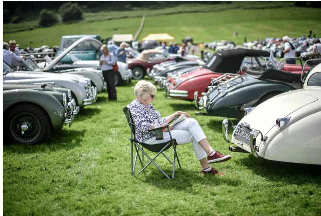
Beim traditionellen Jaguar Festival im englischen Shelsley Walsh tummeln sich Kostbarkeiten in Blech.