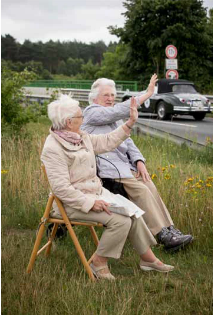
Treue Fans finden sich überall an der Strecke. Bei mehr als 100 Teilnehmern gibt es für sie reichlich zu winken.