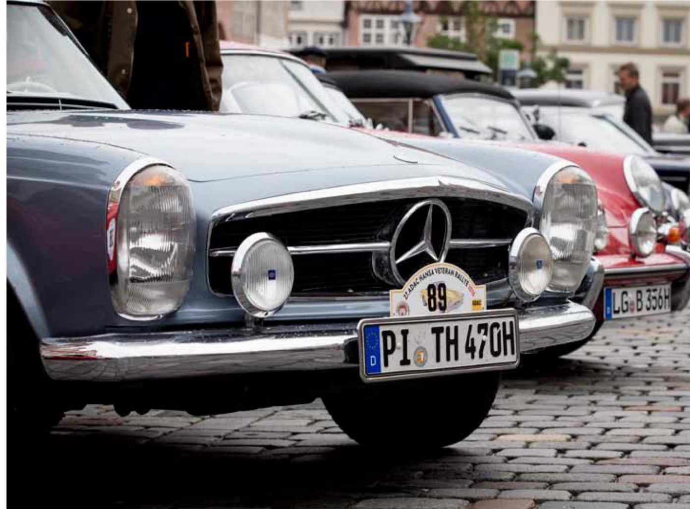
Das Feld dominieren diesmal Autos aus den 1960er- und 1970er-Jahren.