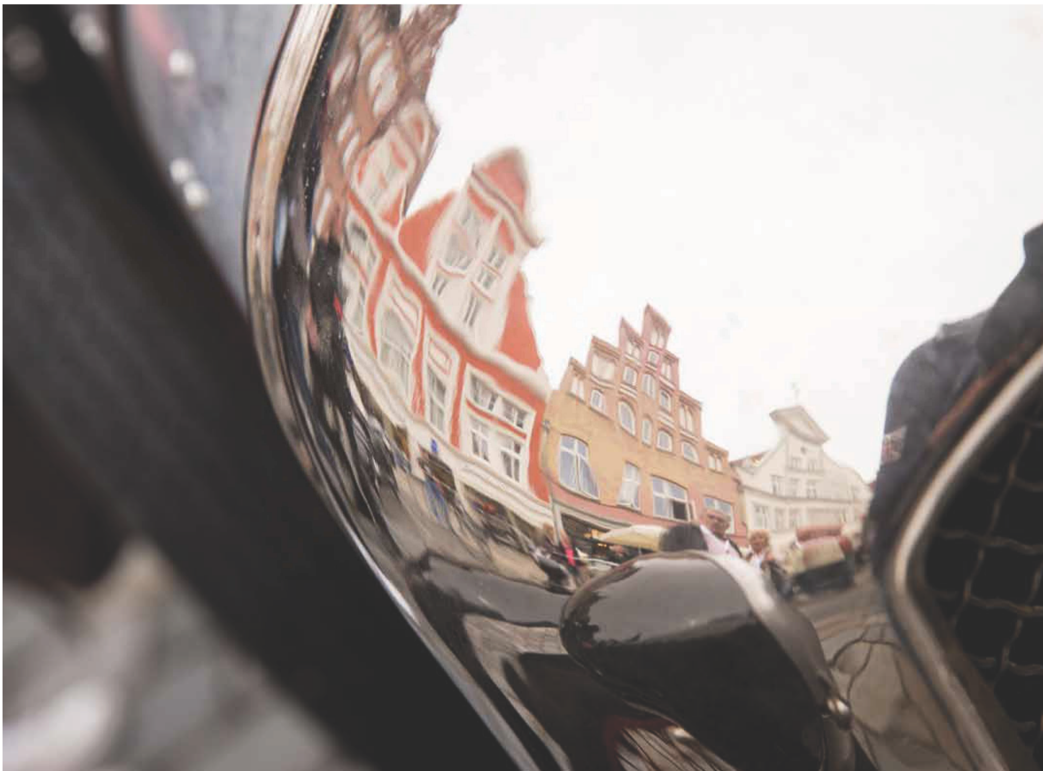
Historische Giebel und historische Fahrzeuge: Das passt. Die Hansa Veteran Rallye zählt zu den beliebtesten Oldie-Veranstaltungen in Norddeutschland.